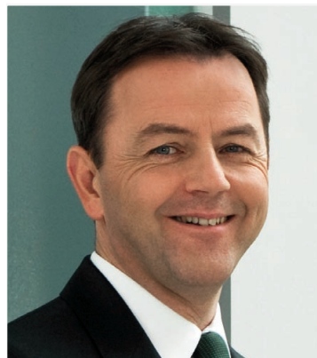
Genuss-Schirmherr Landwirtschaftsminister Niki Berlakovich

Genussmomente. Die viermal jährlich stattfindenden GenussWochen sind Höhepunkte in der Zusammenarbeit der GENUSS REGION ÖSTERREICH mit den österreichischen Genuss Wirten. Gemeinsam mit dem Kooperationspartner BÖG – Beste Österreichische Gastlichkeit wird so der Gedanke der Regionalität weiter ausgebaut. Reservieren Sie gleich online unter www.genusswochen.at bei einem Genuss Wirt in Ihrer Nähe und lassen Sie sich bei einem Genuss-Menü verwöhnen! Werbung